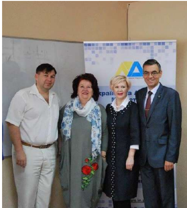
Українська асоціація маркетингу. Семінар «Візуалізація даних маркетингових досліджень»