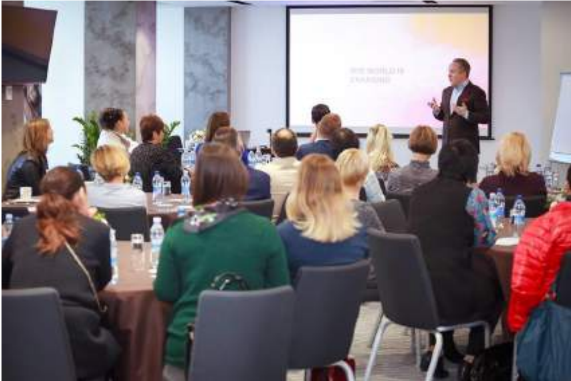
L'oreal Professor's Day. Виступ генерального директора L'oreal Україна.

У вересні 2018 р. викладачі кафедри взяли участь у семінарі «L'oreal Professor's Day». Ціллю якого був обмін досвідом і сучасними наробками передових компаній у галузі маркетингу, з метою забезпечення відповідності надаваних кафедрою знань та вмінь вимогам великих працедавців.