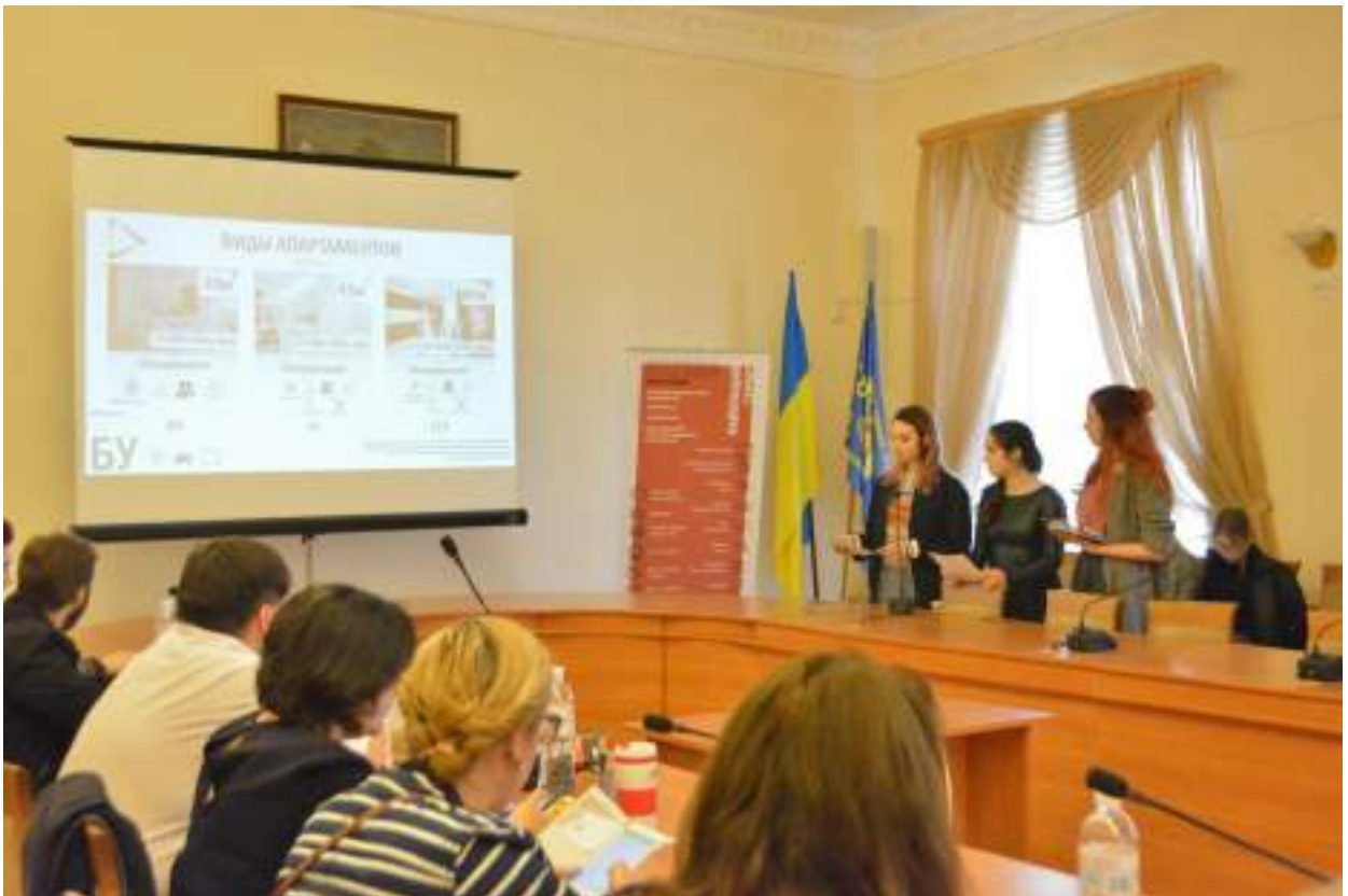
Виступ команди-переможця « Rising Industrial Marketing Stars » (18 квітня 2018 р.)